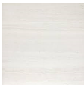
Dlažba slonová kost 60x60cm