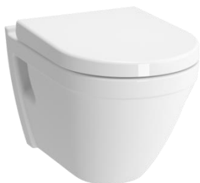
Závěsné WC VitraS50