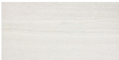
Obklad slonová kost 30x60cm