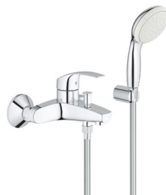
Vanová s příslušenstvím