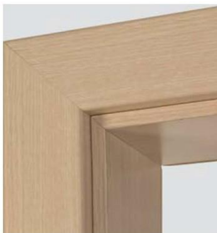
Panty 80/10 niki