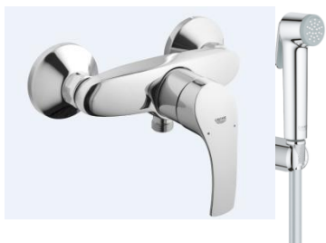
Sprchová s bidetovou sprškou