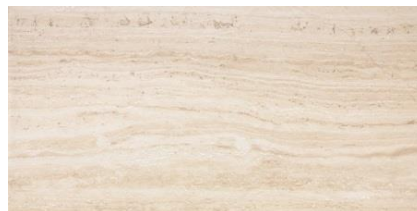
Obklad béžová 30x60cm