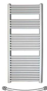
KoradoKoralux Rondo Max, bílý