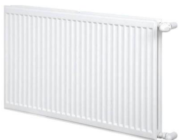
Deskové radiátory KoradoRadik VK