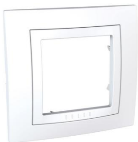
Schneider UnicaPolar – jednoduchý rámeček