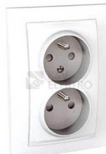
Schneider Unica Basic dvojjásuvka