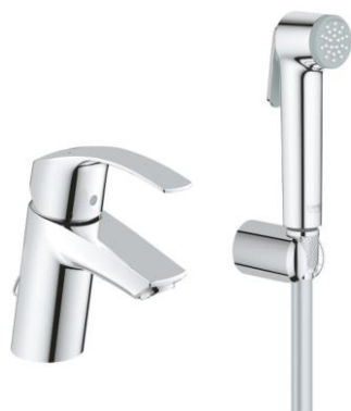
Umyvadlová stojánková s bidetovou sprškou