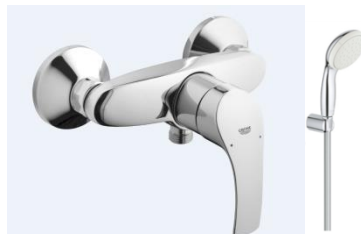
Sprchová s příslušenstvím